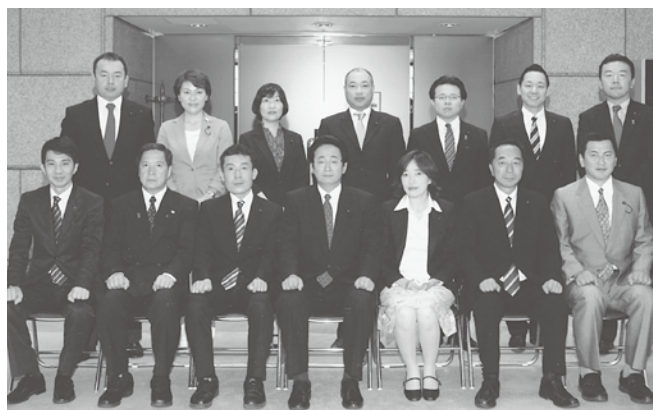
▲写真: 民主党・無所属の会のメンバーです。

埼玉県議会ホームページ: www.pref.saitama.lg.jp/s-gikai/