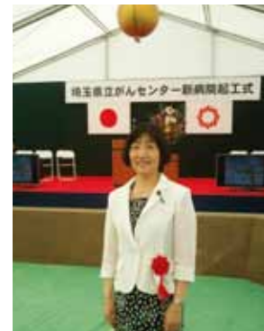
伊奈町に新築される、埼玉県立がんセンターの起工式に参加。