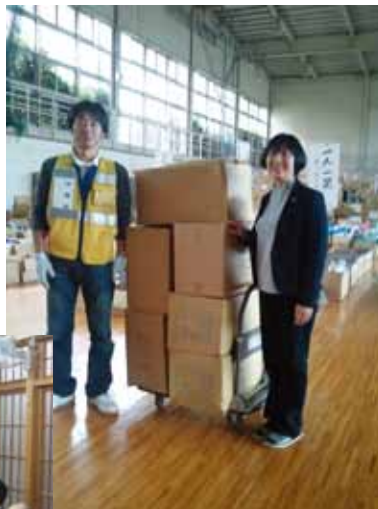
福島県双葉町から旧騎西高校に避難している方々を訪ね、多くの方から寄せられた支援物資をお届けしました。