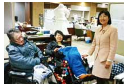
障害者総合福祉法（仮称）の早期制定を求める意見書の説明に来て下さった「さいたま市ノーマライゼーション条例を進める会」の方々と、会派の控室にて懇談しました。