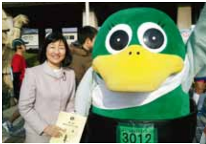
越谷市元旦マラソンの開会式後、昨年11月27日に特別住民票が交付されたガーヤちゃんと記念撮影。

上田知事を先頭に上海のホンダ工場を見学。アセアン議員連盟の一員として視察に参加。