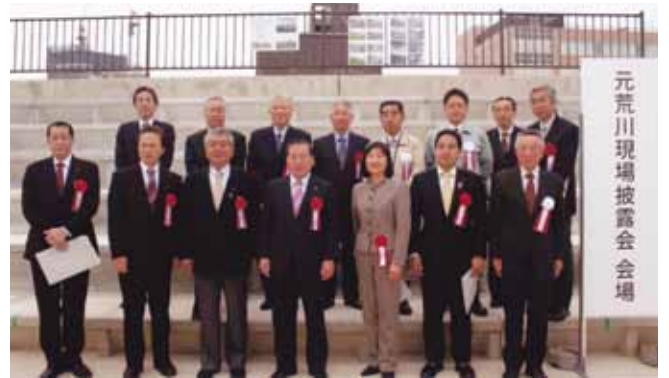
越谷市役所前の元荒川で県事業（水辺再生）で整備された現場の披露会に参加しました。越谷市民まつりでもご利用頂いていました。