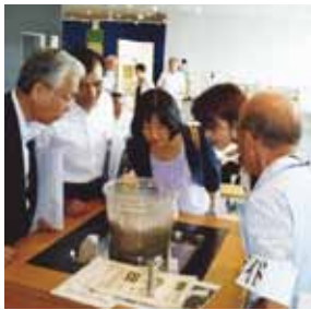
警察危機管理防災委員会で「阪神・淡路大震災記念 人と防災未来センター」を視察。液状化の実験を見学中。