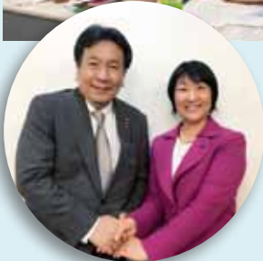
枝野幸男 立憲民主党代表と

立憲民主党自治体議員ネットワークの立ち上げから関わり、副代表として活動中。立憲フェスでは、立憲ミニトーク vol3 「地方政治のこれから」～草の根民主主義のあり方を考える～にパネリストとして参加。